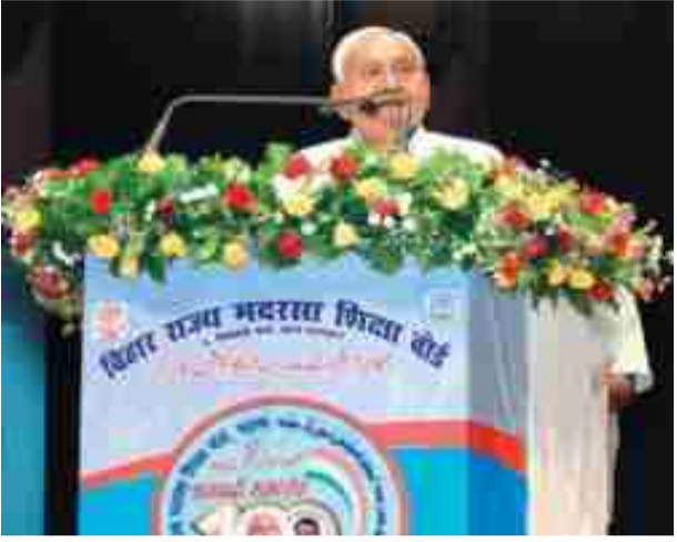
कम पैसा मिलता था। वर्ष 2006 तथा उन्हें सरकारी मान्यता दी गयी से मदरसों का निबंधन किया गया है। मदरसा के शिक्षकों को सरकारी