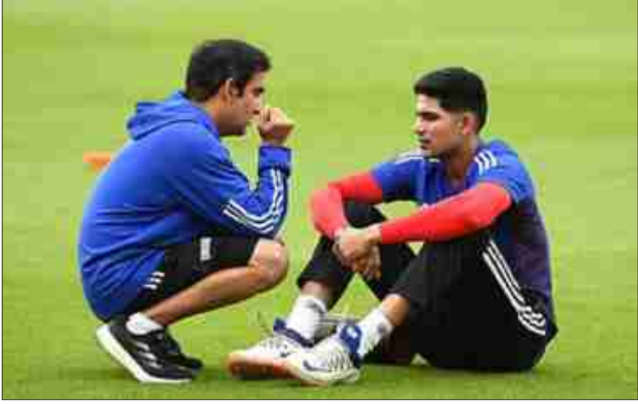
গম্ভীরের কড়া দাওয়াইয়ে বেঙ্গালুরুতে শুরু হচ্ছে ব্রকো টেস্ট।