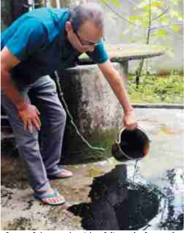
बिधानपल्ली के एक घर के कुएं के पानी में काला तेल मिला हुआ है।

में रिपीटर स्टेशन से सटे दो-तीन साल पहले बिधानपल्ली में भूमिगत तेल के मिल जाने से यह तीन घरों के कुओं के पानी में समस्या शुरू हुई थी। उस समय,