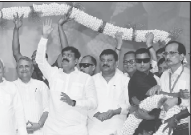
Bihar Chief Minister Nitish Kumar being garlanded by supporters at the centenary celebrations function of Bihar State Madrasa Education Board at Babu Auditorium, in Patna