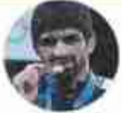
अमन सहरावत रेसलिंग ब्रॉन्ज