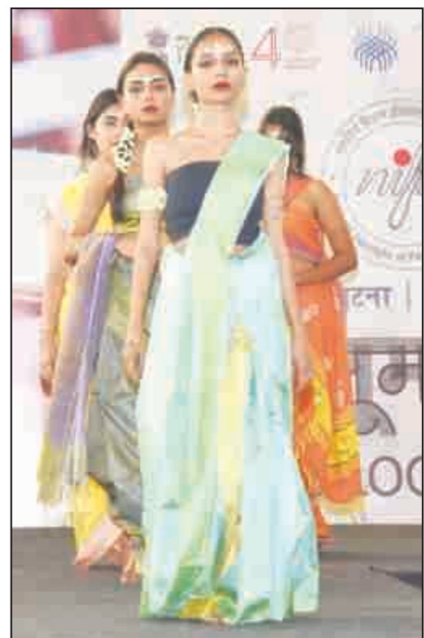
Students of National Institute of Fashion Technology (NIFT) walk a ramp during Handloom Fashion Walk on the occasion of Handloom week, in Patna