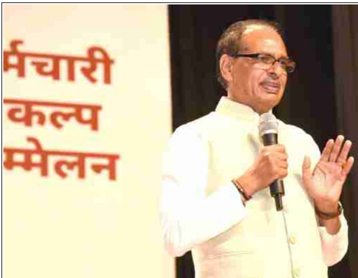
Union Minister for Agriculture & Farmers Welfare and Rural Development, Shivraj Singh Chouhan, interacting with Group 'B' and above level officers of the two ministries at the "Karmachari Sankalp Sammelan" at Pusa, in New Delhi on Thursday

Until that happens, strategic autonomy risks being exposed as little more than a slogan, tested at every turn by the shifting currents of global power. The devil and the deep sea will remain ever-present, and India will find itself navigating between them with no safe harbour in sight. (IPA)