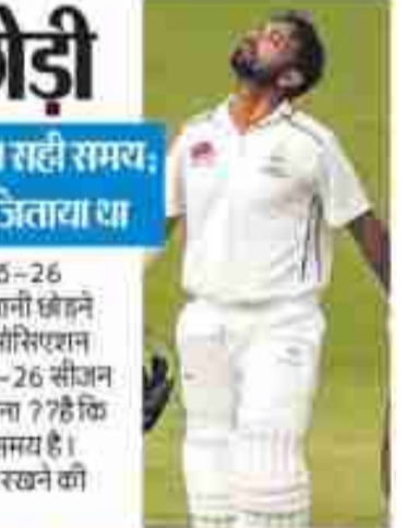
सीजन का इंतजार है- रहाणे

नई दिल्ली (एजेंसी)। अजिंक्य रहाणे ने 2025-26 डोमेस्टिक सीजन से पहले मुंबई टीम की कप्तानी छोड़ने का फैसला किया है। उन्होंने मुंबई क्रिकेट एसोसिएशन (एमसीए) को सूचित किया है कि वह 2025-26 सीजन से पहले कप्तानी छोड़ना चाहते हैं। उनका मानना ? 78 कि यह एक नए लीडर को तैयार करने का सही समय है। हालांकि, उन्होंने बतौर बल्लेबाज खेलना जारी रखने की इच्छा जताई है।