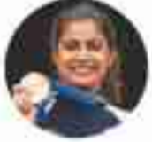
मनु भाकर शूटिंग 2 ब्रॉन्ज

इनमें 4 पेरिस ओलिंपिक के मेडलिस्ट, वर्ल्ड चैंपियन मुकेश का भी नाम